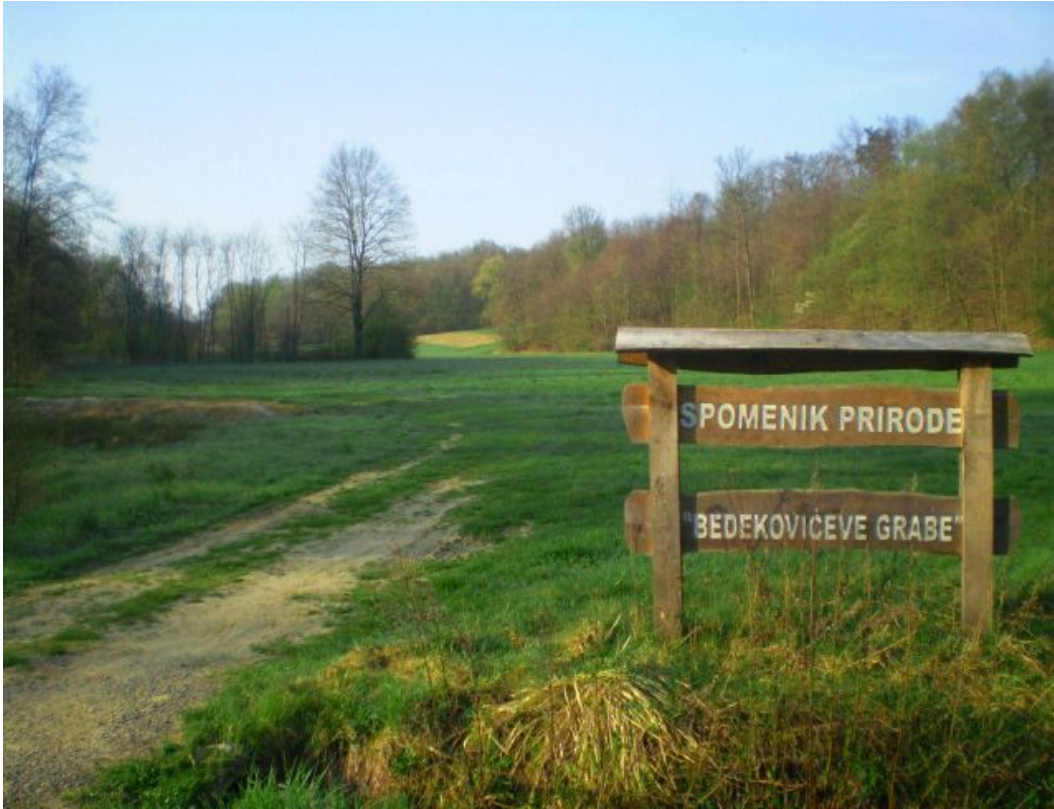
Zaštićeni spomenik prirode Bedekovićeve grabe

slikovnice; dramsku, lutkarsku i glazbenu interpretaciju; istraživanje biološke, povijesne i geografske građe; prezentacije, interaktivne radionice; posjet lokalitetu Bedekovićeve grabe i mnoštvo drugih raznolikih aktivnosti te nastavnih metoda i odgojno-obrazovnih strategija kojima bi se upotpunila i obogatila svakodnevna nastava.